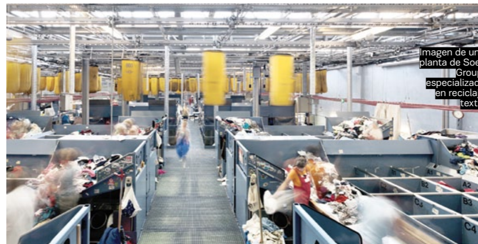
Imagen de una planta de Soex Group, especializada en reciclaje textil.