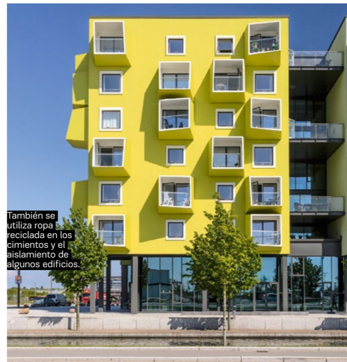
También se utiliza ropa reciclada en los cimientos y el aislamiento de algunos edificios.