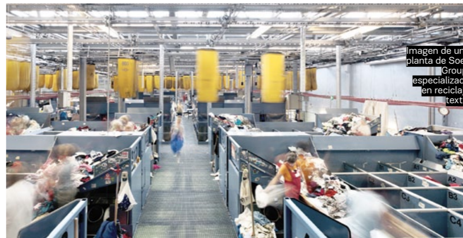
Imagen de una planta de Soex Group, especializada en reciclaje textil.