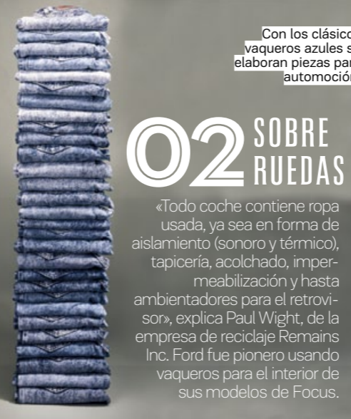
Con los clásicos vaqueros azules se elaboran piezas para automoción.