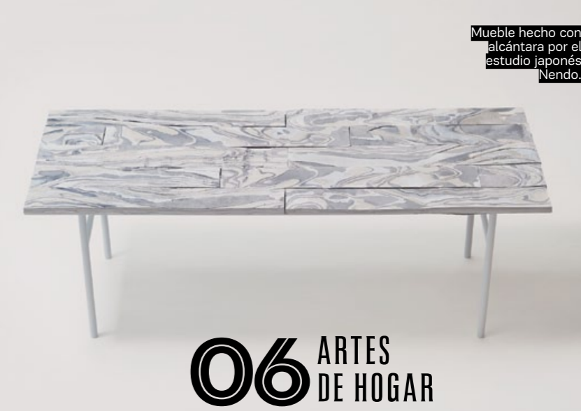
Mueble hecho con alcántara por el estudio japonés Nendo.