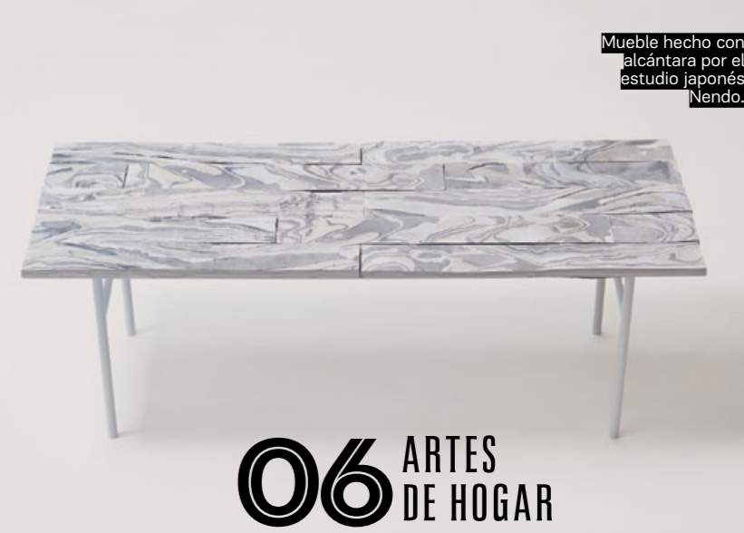
Mueble hecho con alcántara por el estudio japonés Nendo.

«Todo coche contiene ropa usada, ya sea en forma de aislamiento (sonoro y térmico), tapicería, acolchado, impermeabilización y hasta ambientadores para el retrovisor», explica Paul Wight, de la empresa de reciclaje Remains Inc. Ford fue pionero usando vaqueros para el interior de sus modelos de Focus.