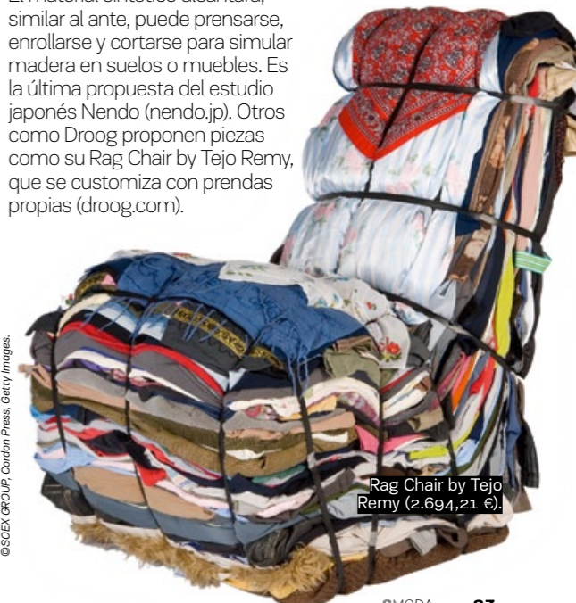
Rag Chair by Tejo Remy (2.694,21 €).

El material sintético alcántara, similar al ante, puede prensarse, enrollarse y cortarse para simular madera en suelos o muebles. Es la última propuesta del estudio japonés Nendo ( nendo.jp ). Otros como Droog proponen piezas como su Rag Chair by Tejo Remy, que se customiza con prendas propias ( droog.com ).