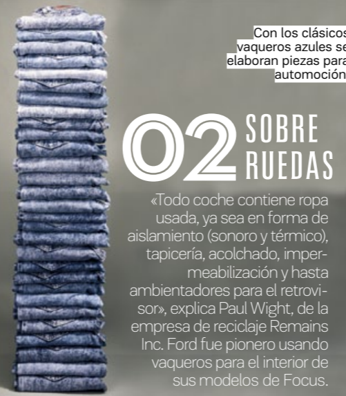
Con los clásicos vaqueros azules se elaboran piezas para automoción.